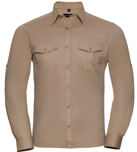
918M Men's Roll Long Sleeve Fitted Twill Shirt SIZE S-4XL